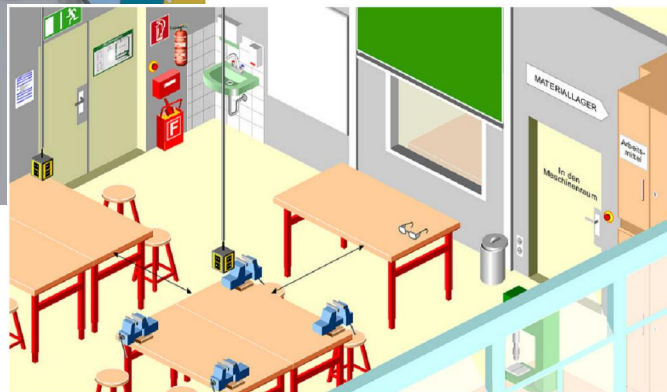
Abb.2: Einrichtung und Betrieb eines Technikraums